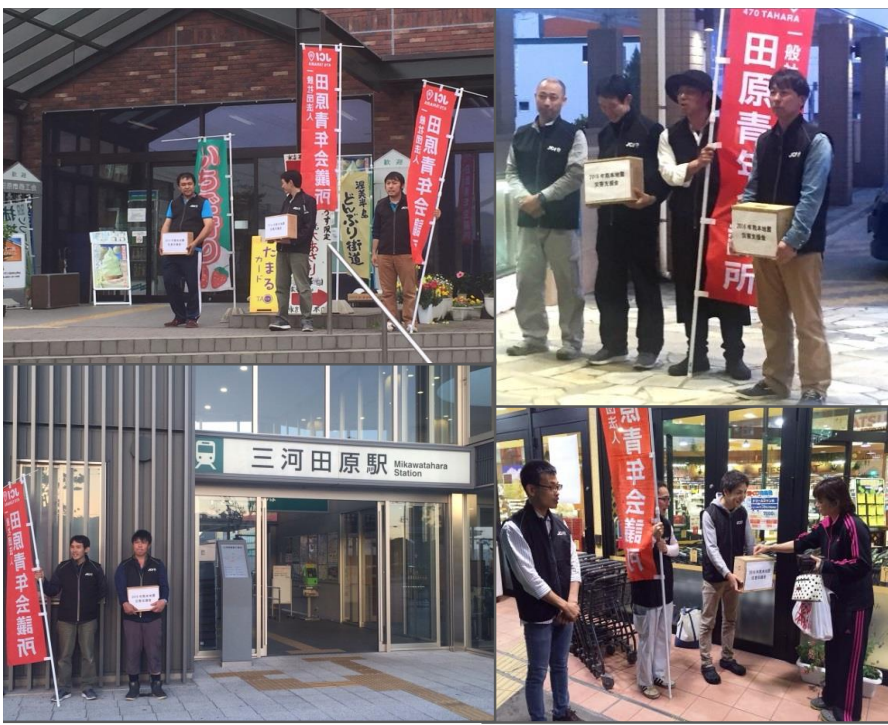
募金活動を行う田原青年会議所メンバー